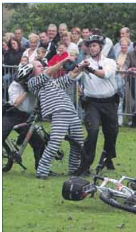
Geniet tijdens de Landelijke Politiedag van spectaculaire demonstraties

Elke locatie heeft een eigen programma: Kijk voor meer informatie en een routebeschrijving op www.politiemwb.nl .