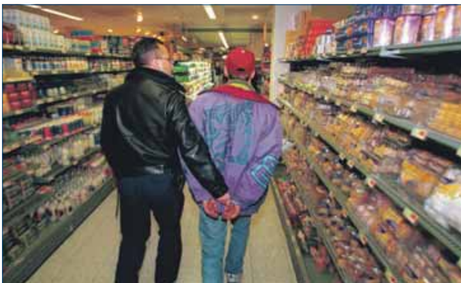
First offenders worden maximaal zes uur vastgehouden, veelplegers een stuk langer.

Kijk voor meer informatie op www.om.nl of op www.politie.nl .