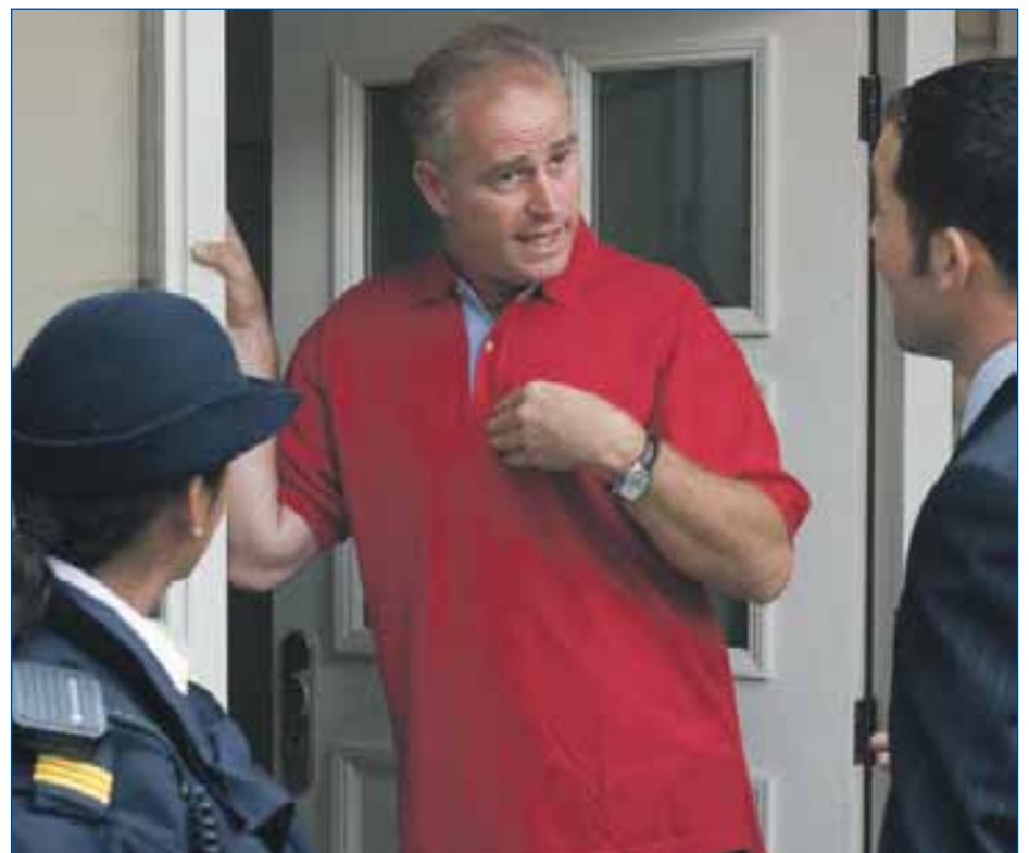
Een deurwaarder voor uw deur omdat een ander op uw naam een crimineel leven heeft opgebouwd.

Geef ook digitale inbrekers geen kans. Beveilig uw netwerk. Internetcriminelen houden namelijk lijsten bij waar alle onbeveiligde routers zich bevinden. Zij hoeven alleen nog maar in de auto te stappen om vrij spel te hebben over uw computer. In een handomdraai beschikken ze over uw wachtwoorden van telebankieren. Kijk op politiewb.nl onder het kopje 'veilig draadloos' hoe u uw netwerk beveiligt.