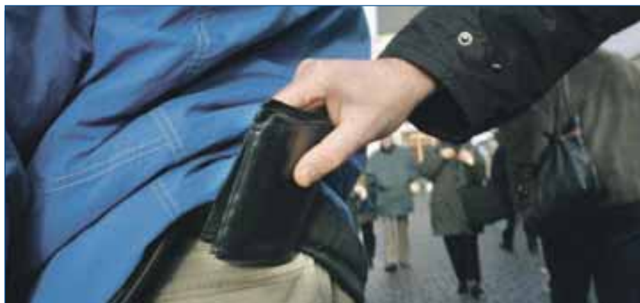
Voor u het weet, bent u uw papieren kwijt.

lijk geen persoonlijk contact met de politie, maar makkelijk is het wel. Elke maand maken zo'n 2.000 inwoners van Midden en West Brabant hier gebruik van.