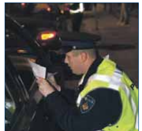
De politie controleert extra tijdens de donkere wintermaanden.

Het is de tweede keer dat de politie Midden en West Brabant criminaliteit tijdens de donkere maanden 'gebundeld' aanpakt. Kijk voor meer preventie-informatie op www.politiemwb.nl .