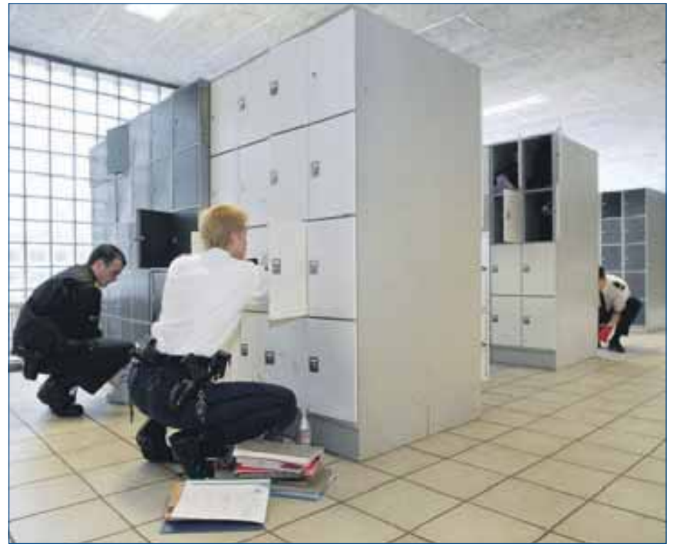
Agenten voeren soms kluisjescontroles uit op scholen.

Kijk voor meer informatie op www.schoolveiligheid.nl www.dgsg.nl www.stopgeweldopschool.nl www.stopdigitaalpesten.nl www.pestweb.nl www.kinderconsument.nl