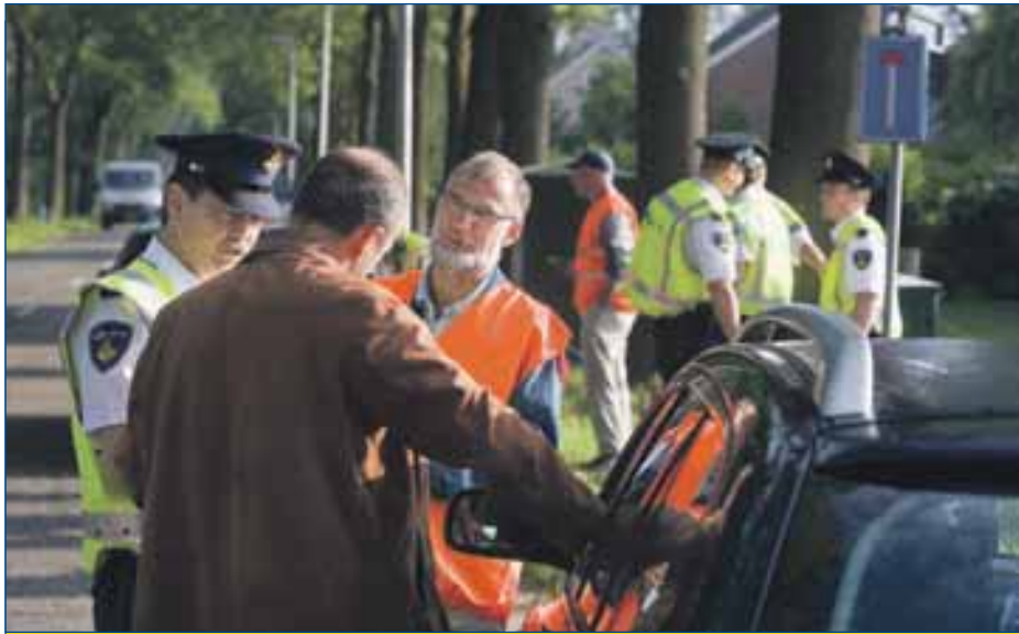
Een buurtbewoner assisteert de politie en spreekt bewoners aan op hun rijgedrag.

Buurtbewoners en weggebruikers voelen zich soms onveilig in het verkeer. Dit gevoel is niet altijd terug te vinden in harde ongevalcijfers. De politie kan echter ook optreden als er nog geen ongelukken zijn gebeurd.