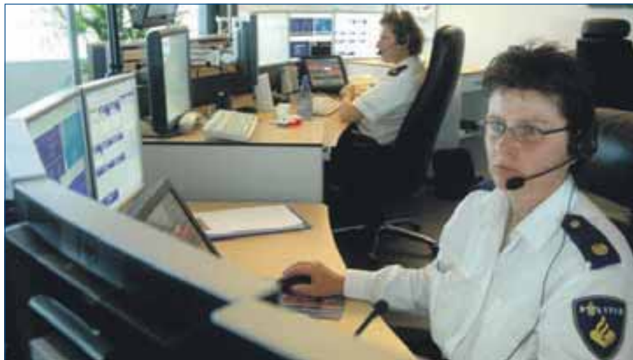
De centrale meldkamer houdt overzicht en stuurt politie op straat aan.