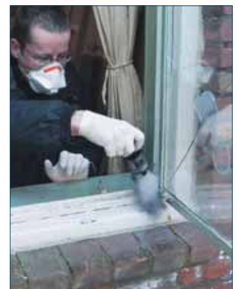
Bij inbraak kan elk detail leiden tot aanhoudingen.

Kijk voor meer informatie op www.nederlandveilig.nl en www.politiekeurmerk.nl .