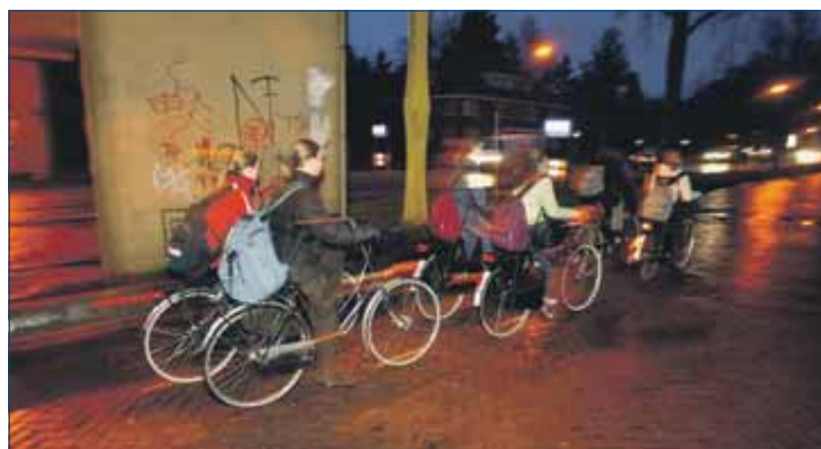
Leerlingen zichtbaar en veilig op weg naar school.

www.fietslichtaan.nl www.verkeershandhaving.nl www.boetebase.nl www.daarkunjemeehuiskomen.nl